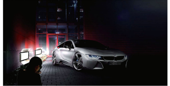
明るく発光面も大きいので、大きな撮影物でも完璧に照明することができます。また演色性も高く肌を忠実に再現します。