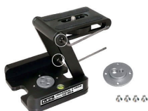
Universal Z Head UZ-90A