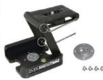
Universal Z Head UZ-90A